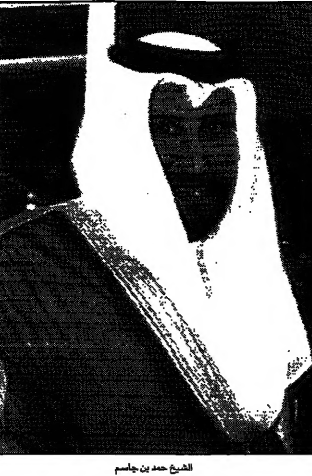
الشيخ حمد بن جاسم

شارها خاصة انها جاءت بعد حرب 1973 في حين اننا خلفنا مسيرة المفاوضات التي فيها اتفقنا على ثلاث فقط واستمر اختلاف الموقف بشأن اثنين آخرين فذلك الفصل من الاعلان عن اتفاق كامل لا أساس له من الصحة.